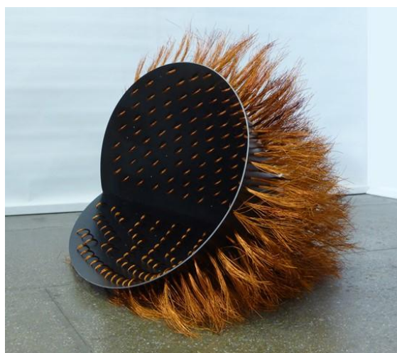
Vanessa Notley, Hairy Mary, 2016, acier et fil de cuivre, 80 x 43 x 53 cm

« Le vestibule est une pièce ou un couloir qui donne accès à un intérieur. En anatomie, il désigne la cavité de l'oreille interne. C'est une antichambre qui filtre, un espace dont l'accès peut être accepté ou refusé, un entre-lieu qui permet d'hésiter et, en anglais, le « mudroom » désigne un lieu de débarras, on y laisse ses bottes boueuses.