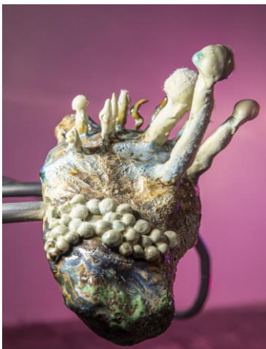
Damien Fragnon, Un vent rocheux , sept grés, céramique émaillée, poils collés électromagnétiquement, 2022

Les œuvres de Damien Fragnon abordent librement et intuitivement la question du rapport entre l'humain et la nature. À mi-chemin entre récit d'anticipation et science, entre fantaisie et expérience de l'observation, il révèle la multiplicité des mondes.