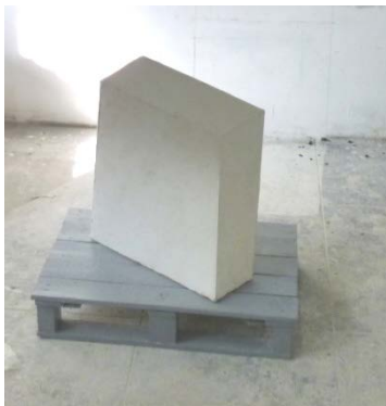
Tjeerd Alkema, 2015 avec caisse, Plâtre, métal, bois, 67 x 47 x 45 cm

Les sculptures comme les dessins de Tjeerd Alkema ont déjà été présentés par la Galerie AL/MA. Cette fois, c'est leur rapprochement qui est mis en avant. Et d'abord, le libre usage du dessin qui peut dessiner une sculpture à venir, en donner le programme perceptif ou se déployer selon les possibilités propres à l'illusion de perspective. Aller donc de la 2 ème à la 3 ème dimension ou inversement déployer la 3 ème dimension dans la seconde avec tous les « artifices » de la perspective.