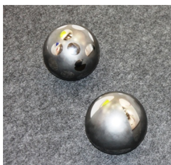
Vladimir Skoda, Acier 21 Ø

Pour aborder les sphères en acier posées au sol de Vladimir Skoda, il faut d'abord en mesurer physiquement leur masse et leur assise. Et même si l'acier poli réfléchissant l'espace peut donner l'illusion d'une certaine légèreté au regard de nos forces, la réalité de l'objet s'impose brutalement : difficile à porter, à mouvoir. Hors de prise pour notre corps. Chez Skoda, la sphère n'est pas simplement la forme posée au sol ; elle est aussi sphère céleste ; mouvement de rotation ; comète ou gaz. Etats variables de la matière et du temps. Et donc, une possibilité de jouer par le dessin de la multiplicité des relations entre intérieur et extérieur, entre mouvement/vitesse et fixité, entre plans différents. Le dessin redouble et multiplie les recherches, expérimentant, avec une légèreté et une rapidité impossibles dans l'exercice de la sculpture, les conditions de ses futures installations.