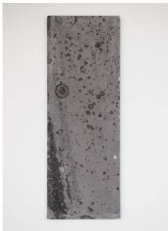
Arnaud Vasseux Lichens (Kerguelennec), 2013 résine acrylique armée, colorant, 36,5 x 102 x 2,8 cm

Cela vaut aussi pour l'œuvre d'Arnaud Vasseux qui explore les circonstances d'apparition d'une trace. Les grandes encres flottantes sont des captations de surface, faisant référence à un mécanisme instable, presque archaïque et anachronique. Ses empreintes d'encre et de goudron dessinent d'imprévisibles univers. Les sprays procèdent d'un principe très différent, l'objet étant dessiné par la projection d'un brouillard de peinture noire mate, le résultat s'apparente alors à un rendu photographique. Les protocoles qui président à la réalisation des sculptures d'Arnaud Vasseux peuvent être comparés à ceux des dessins. Deux œuvres, l'une en résine, privilégie l'idée d'empreinte - celle d'un toit parasité par des taches de lichen ; et l'autre, celle de tension et de torsion, par le biais d'une masse contrainte et pliée en plâtre blanc. Le dessin aussi peut se penser à la fois comme empreinte et comme pli. Comme surface de réception ou comme force active.