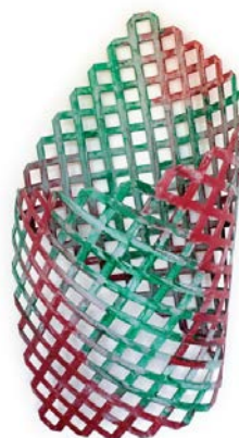
Daniel Dezeuze, Pavillon, 2001 peinture sur polyéthylène, 200 x 120 x 70 cm

Objet d'une publication de textes et de dessins de Daniel Dezeuze, L'art de la solitude* , les dessins de Rochers chinois présentés à la galerie AL/MA ont été inspirés par les formes tourmentées de pierres remarquables, creusées de multiples cavités après un séjour prolongé dans les eaux du lac Taï. Loin de la représentation, les dessins de Daniel Dezeuze s'affranchissent de toute servitude envers l'objet désigné comme « motif » et jouent des ambiguïtés de la mise à plat du dessin et des formes qu'il fait apparaître et que l'œil s'empresse de faire glisser vers des éléments de relief. A leur manière, les trois Pavillons (2002), questionnent aussi cette ambiguïté de la surface et du volume. La simplicité de la forme ne signifie pas la simplicité de l'expérience de perception. De multiples jeux se glissent de l'une à l'autre.